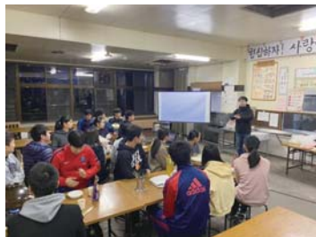
愛知中高寮生との交流会